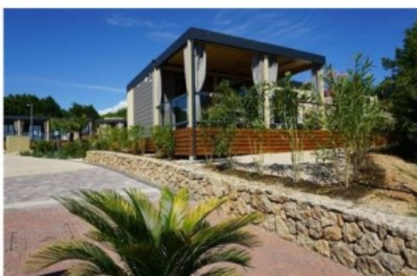
NEMOVITOST V CHORVATSKU (ILUSTRACNÍ SNÍMEK)

PRAHA Češi v posledních letech stále více kupují nemovitosti v zahraničí. Největší zájem je o stavby v Rakousku, Chorvatsku, Itálii a Španělsku. Více než domy a vily jsou populární apartmány. Vyplývá to ze studie společnosti Rellox, která se zaměřuje na prodej zahraničních nemovitostí. Ceny nemovitostí v Česku rostly v prvním čtvrtletí nejrychleji ze zemí Evropské unie.