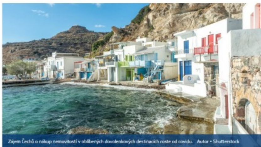
Zájem Čechů o nákup nemovitostí v oblíbených dovolenkových destinacích roste od covidu.