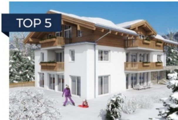
Kaprun, Rakousko od 389 000 EUR »