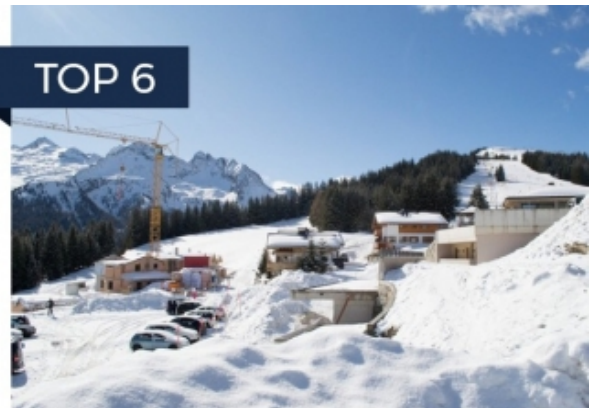
Zillertal Arena, Rakousko od 514 700 EUR »